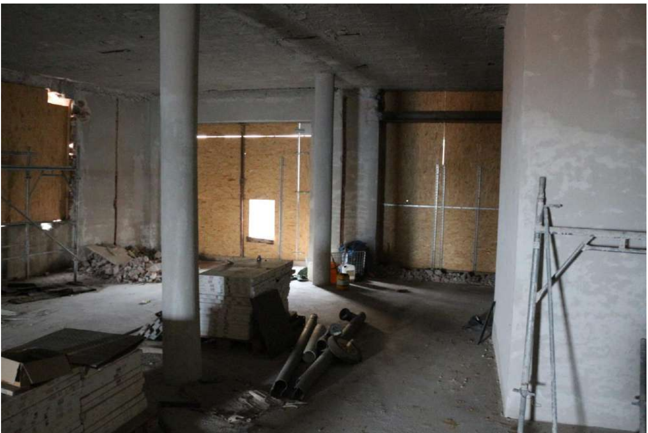
FOTO n°28. - visione interna tipo – unità definita come "al grezzo"