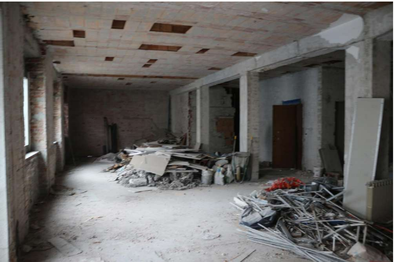
FOTO n°24. - visione interna tipo – unità definita come "al grezzo"