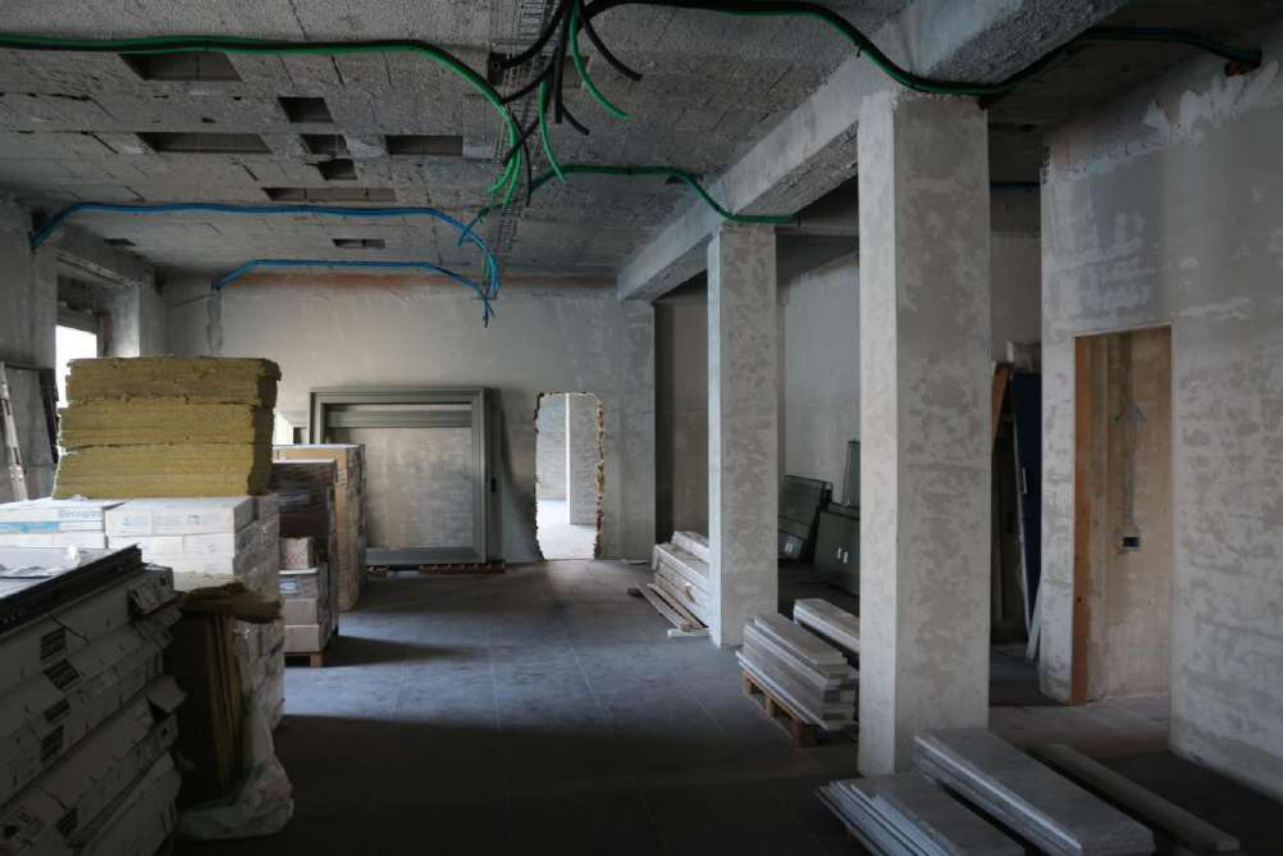
FOTO n°23. - visione interna tipo – unità definita come "al grezzo avanzato"