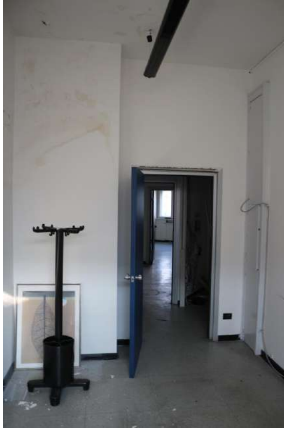
FOTO n°19. - visione interna tipo – unità definita come "abitabile ma vestusta"