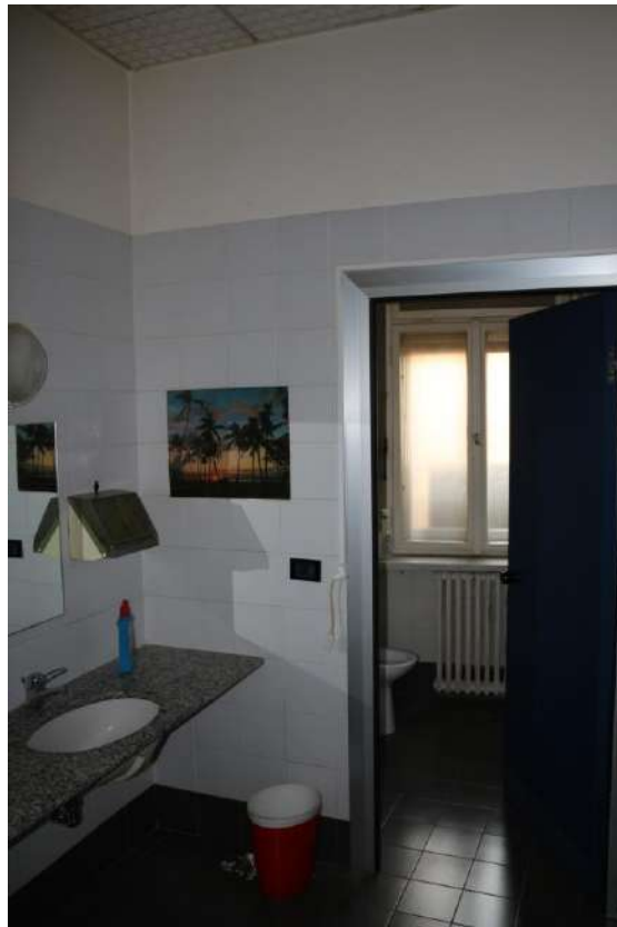
FOTO n°14. - visione interna tipo – unità definita come "abitabile ma vestusta"