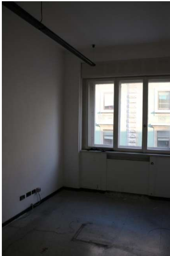
FOTO n°18. - visione interna tipo – unità definita come "abitabile ma vestusta"