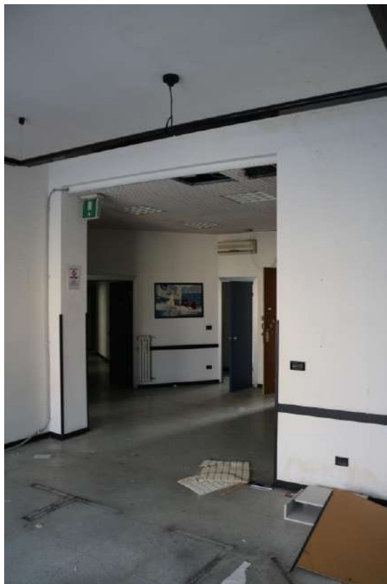
FOTO n°16. - visione interna tipo – unità definita come "abitabile ma vestusta"