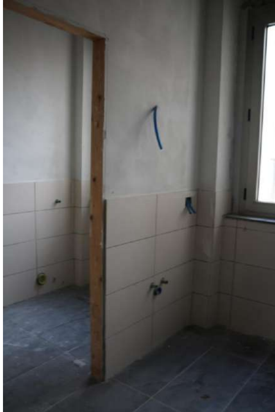
FOTO n°20. - visione interna tipo – unità definita come "al grezzo avanzato"