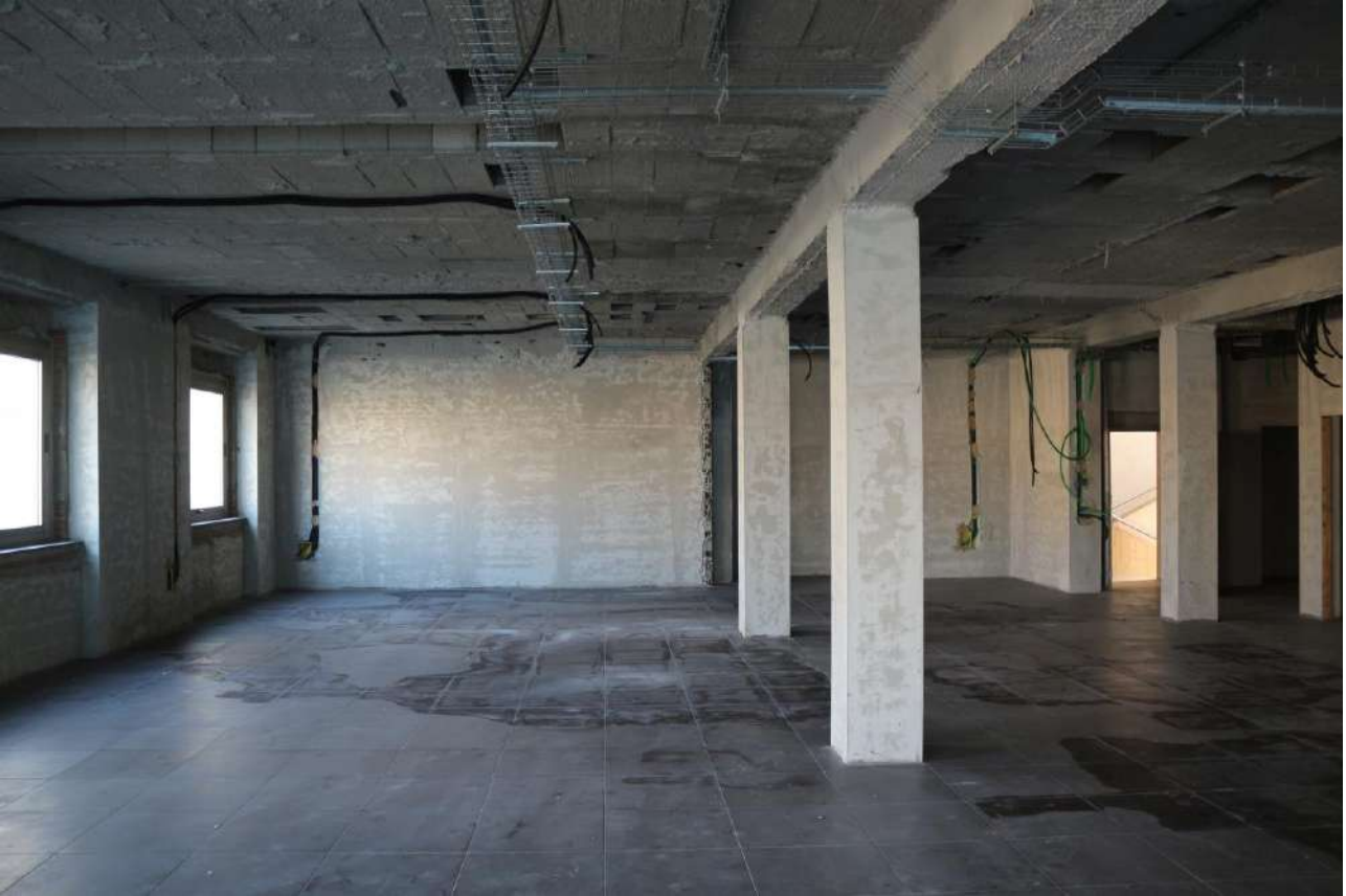
FOTO n°21. - visione interna tipo – unità definita come "al grezzo avanzato"