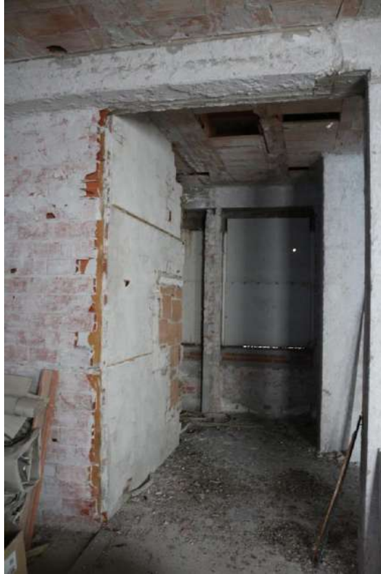
FOTO n°25. - visione interna tipo – unità definita come "al grezzo"