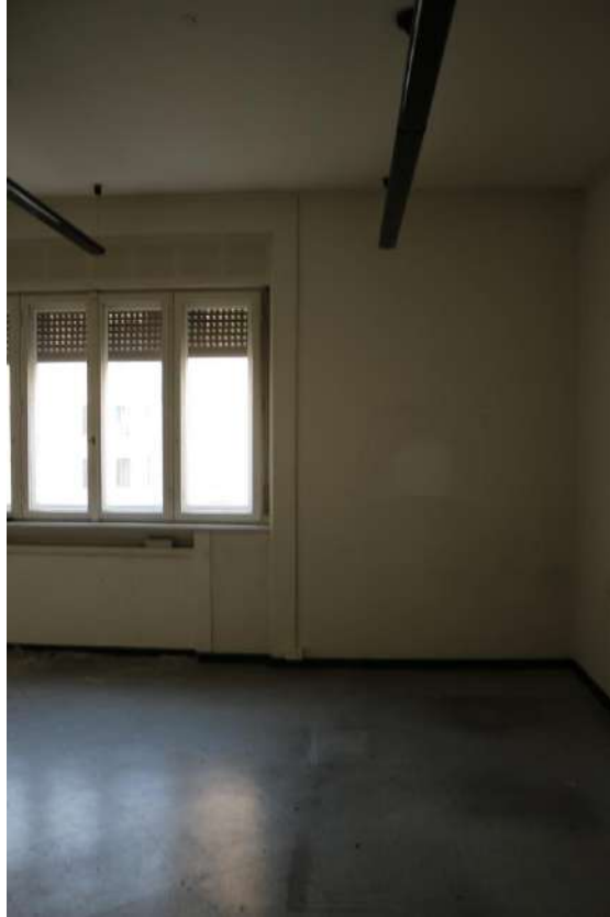
FOTO n°17. - visione interna tipo – unità definita come "abitabile ma vestusta"