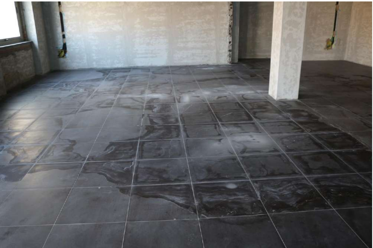
FOTO n°22. - visione interna tipo – unità definita come "al grezzo avanzato"