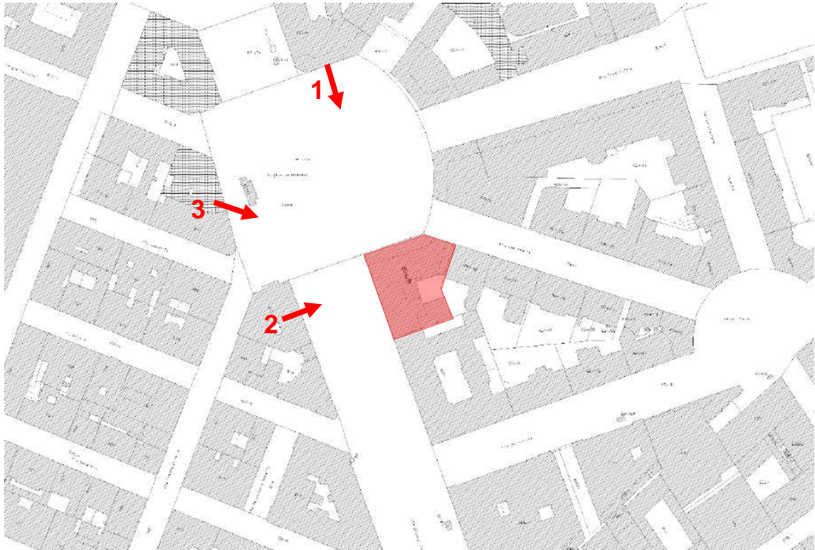
PLANIMETRIA CON POSIZIONE E NUMERAZIONE FOTO ESTERNE