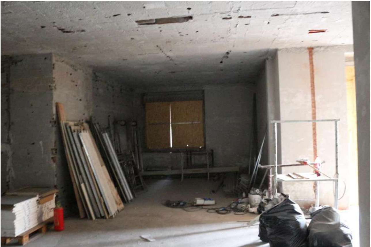
FOTO n°27. - visione interna tipo – unità definita come "al grezzo"