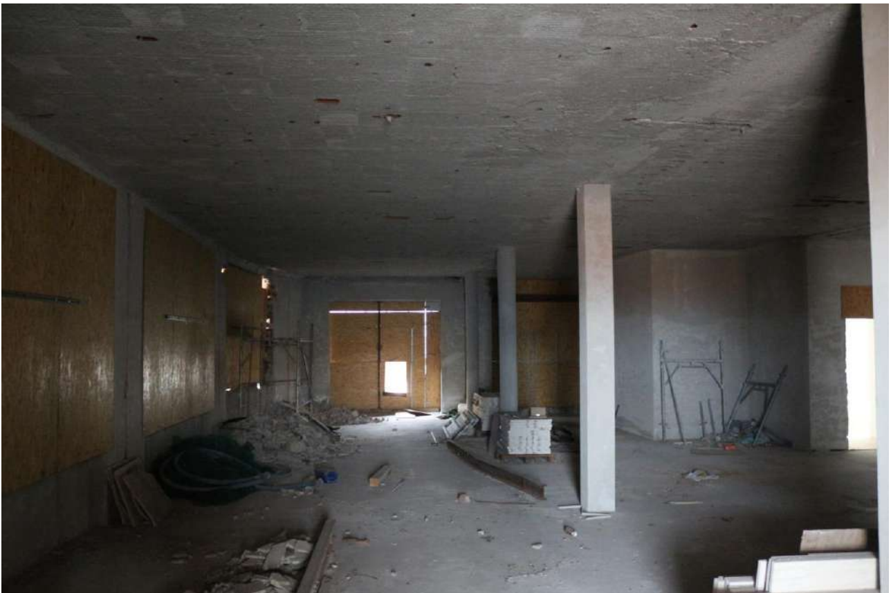
FOTO n°26. - visione interna tipo – unità definita come "al grezzo"